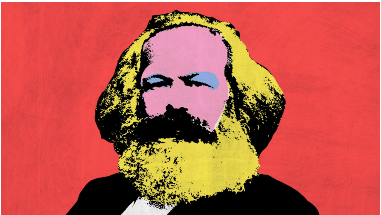
“Karl Marx”, του Andy Warhol.

Το πέπλο θα διαλυθεί και οι κοινωνικές σχέσεις θα γίνουν διαφανείς μόνον όταν η ίδια η κοινωνική διαδικασία της ζωής, ο κοινωνικός μεταβολισμός ανθρώπου και Φύσης απελευθερωθεί από τα δεσμά της καπιταλιστικής μορφής του και τεθεί σε συνειδητό συλλογικό έλεγχο από μια μελλοντική κοινωνία ελεύθερων συνεργαζόμενων παραγωγών.