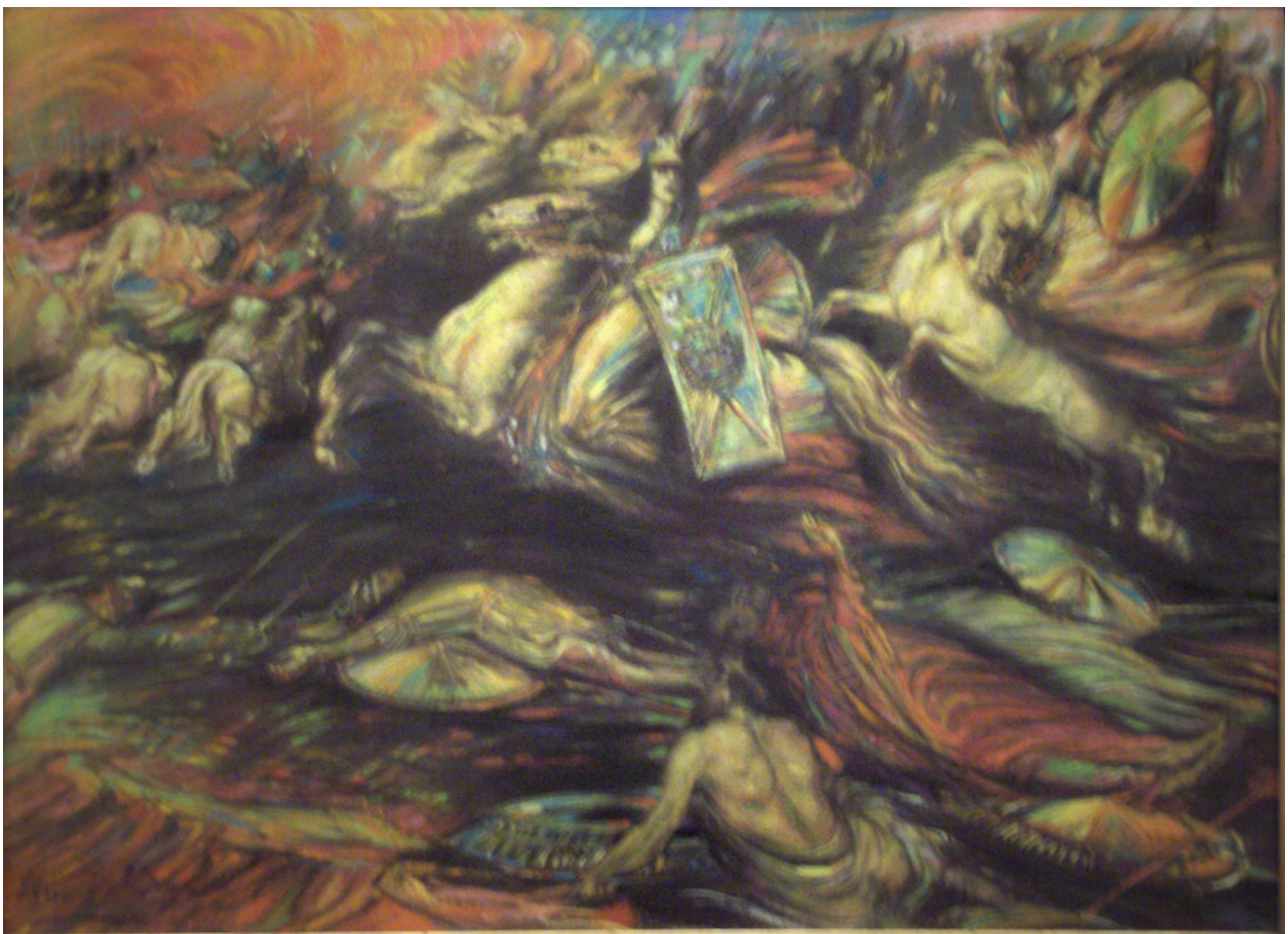
“De Walkurenrit” (Η Επέλαση των Βαλκυριών), του Henry de Groux, περ. 1890.

Ο ίδιος ο λυκοφωτικός καπιταλισμός βουλιάζοντας στην παρακμή και την κρίση σπέρνει ανέμους αλλά θα θερίσει θύελλες. Οι λαϊκές εξεγέρσεις που γνωρίσαμε την προηγούμενη δεκαετία στην Αραβική Ανατολή, στη Νότια Ευρώπη των πλατειών, στην επαναστατημένη Λατινική Αμερική, μέσα στην ίδια την αμερικανική Μητρόπολη του αδικοχαμένου από την ρατσιστική αστυνομική βία George Floyd, ήταν μονάχα το προμήνυμα των Επερχομένων.