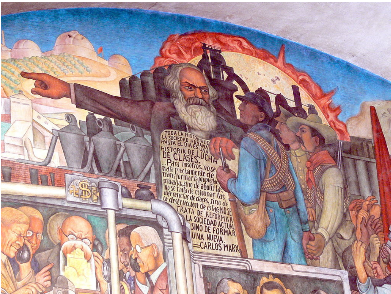
Λεπτομέρεια από την τοιχογραφία του Diego Rivera στο Palacio Nacional της Πόλης του Μεξικού.

Η διαλεκτική υλιστική ανατροπή του Χέγκελ θα δώσει τον “μαγικό σκούφο” και η κριτική της πολιτικής οικονομίας και του Ρικάρντο θα σπλίσει τον Μαρξ με το σπαθί για να μπορέσει στο Κεφάλαιο σαν Περσέας να κυνηγήσει τα τέρατα, χωρίς να τον μαρμαρώσει η κεφαλή της Μέδουσας: ο φетиχισμός του εμπορεύματος, του χρήματος, του κεφαλαίου .