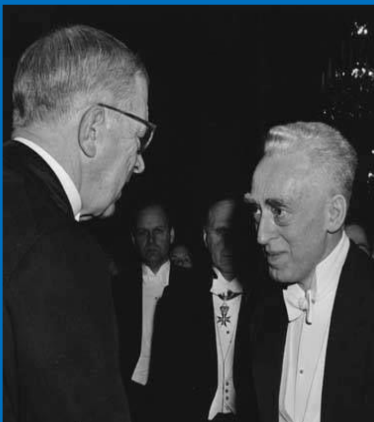
Ο Sraffa, το 1961, κατά τη βράβευσή του από τη Σουηδική Ακαδημία, με το Χρυσό Μετάλλιο Söderströmska

Το έτος 1961, ο Sraffa τιμήθηκε με το Χρυσό Μετάλλιο Söderströmska, από τη Σουηδική Ακαδημία, το οποίο ήταν ο πρόδρομος του Βραβείου Νομπέλ Οικονομικών Επιστημών.