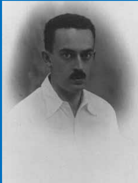
Piero Sraffa, 1929

Σχετικά με 1ο Συνέδριο του Study Group on Sraffian Economics «Ολοκλήρωση και Υπέρβαση της Παραδοσιακής Πολιτικής Οικονομίας και Οικονομικής Πολιτικής: Από τη Διαμάχη για το Κεφάλαιο του 1960 στην Ελλάδα της Virtual Πτώχευσης του 2010», 11 & 12 Απριλίου 2019, Αμφιθέατρο Σάκη Καράγιωργα II, Πάντειο Πανεπιστήμιο